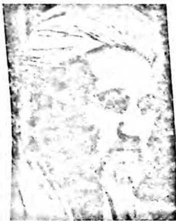
Полвоншириз Ҳожн Юсупов

“Улуғ Туркистон” газетасида ёзилишича, 1917 йил 3 август кунн кечқурун Тошкент шаҳрида “Шўроин Ислония” жамияти биносида Турк Адами Марказият