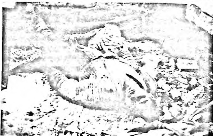
Туркистон Мухторияти ҳукумати қизил гвардиячилар ва арман дашиноқлари томонидан тор-мор қилингандан сўнг. Қўқон қирғини (1918 йил февраль)