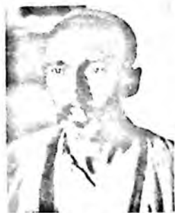
Катта Эргаш кўрбоши

Кичик Эргаш кўрбошини бу пайтда Кўконда фаолият кўрсатган Катта Эргаш ёки Мулла Эргаш (1882-1921) кўрбоши билан чалкаштирмаслик лозим. Кичик Эргаш ҳалок бўлгач, унинг ўрнига Катта Эргаш совет режимига қарши Фарғона водийсида бошланган истиқлолчилик ҳаракатига раҳбарлик қилди. Маркази