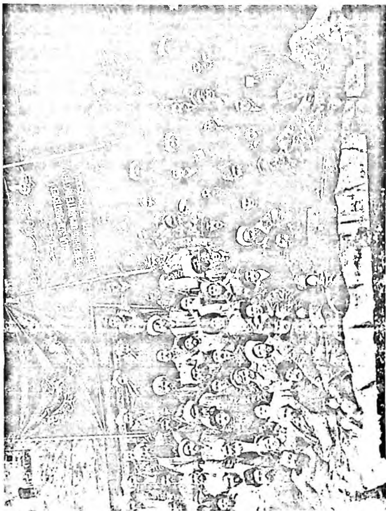
Туркистон Мухторияти Миллат Мажлиси аъзолари (Кўҳон, 1917 йил ноябрь)