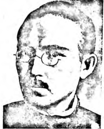
Аҳмад Заки Валидий

Туркистон ўлка мусулмонлари Марказий Шўроси – Миллий марказга раис қилиб Мустафо Чўқай, унга ўринбосарлар қилиб Шоислом Шоаҳмедов, Аҳмад Заки Валидий ва Убайдулла Хўжаев сайландилар. Бу эса ташкилотларни бирлаштириш билан бирга миллий озодлик ҳаракатини изга солиб, уларни ташкилий жиҳатдан марказлаштирар эди 149 .