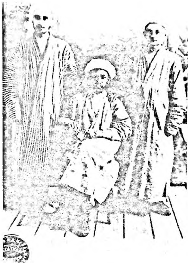
Фитрат шогирдлари даврасида

харакати ва Туркистон Мухторияти ҳукуматининг тарихий ўрнини, мухторият учун кураш ва уни сақлаб қолиш кераклигини куйидагича кўрсатади: