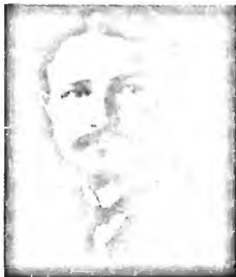
Ислом Султон Шоахмедов

Ислом Султон Шоахмедов [Шоҳислом Шагисултонович Шағнахметов] (1882-1922) – таниқли мусулмон жамоат ва сиёсат арбоби.